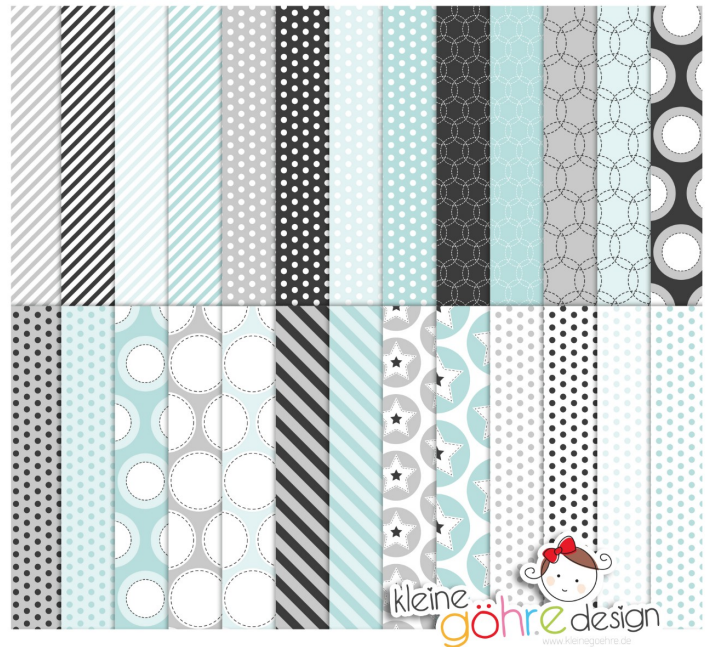
digitale Papiere "Meilensteine Jungs 2"